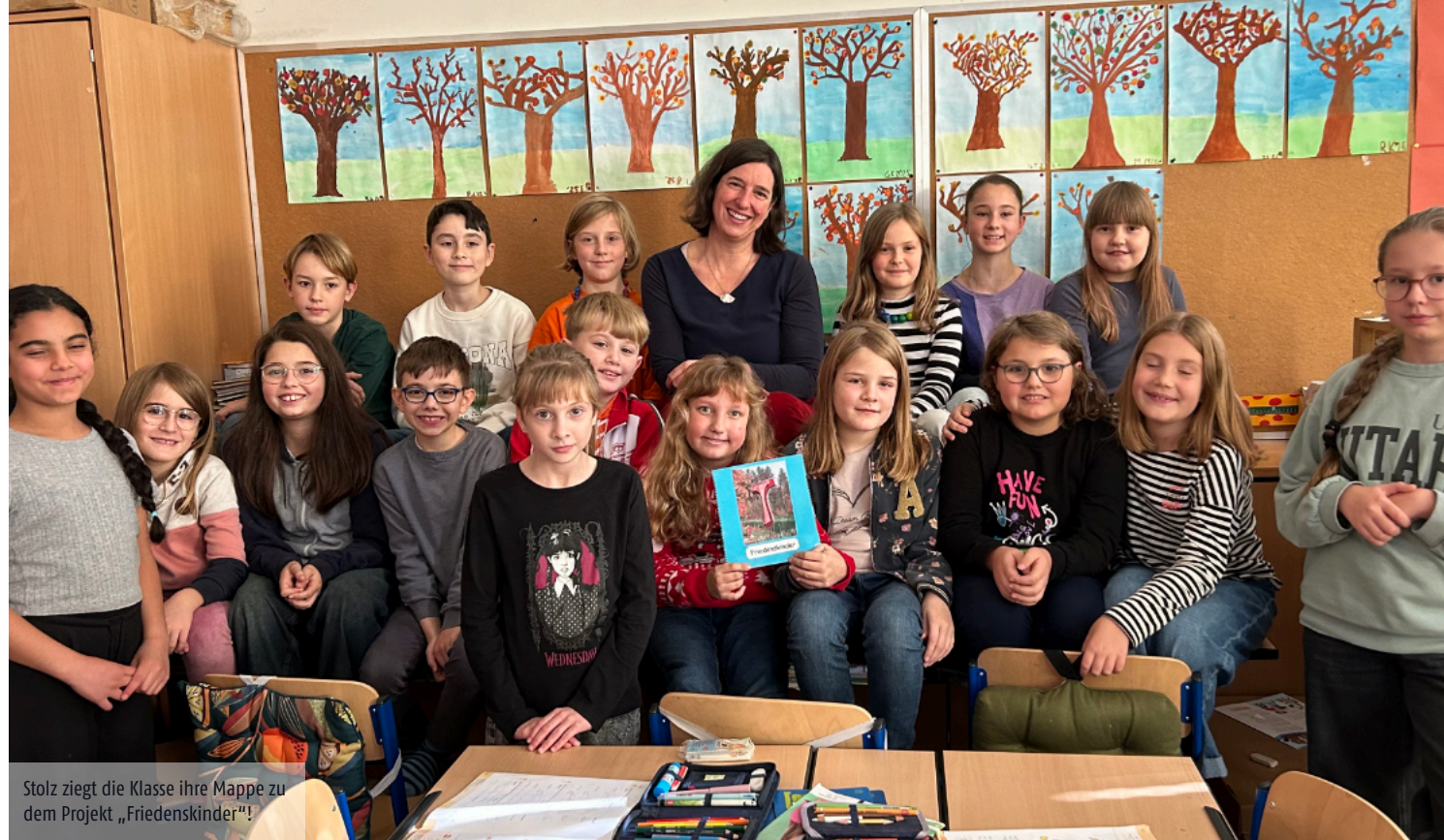
Stolz zieht die Klasse ihre Mappe zu dem Projekt „Friedenskinder“!