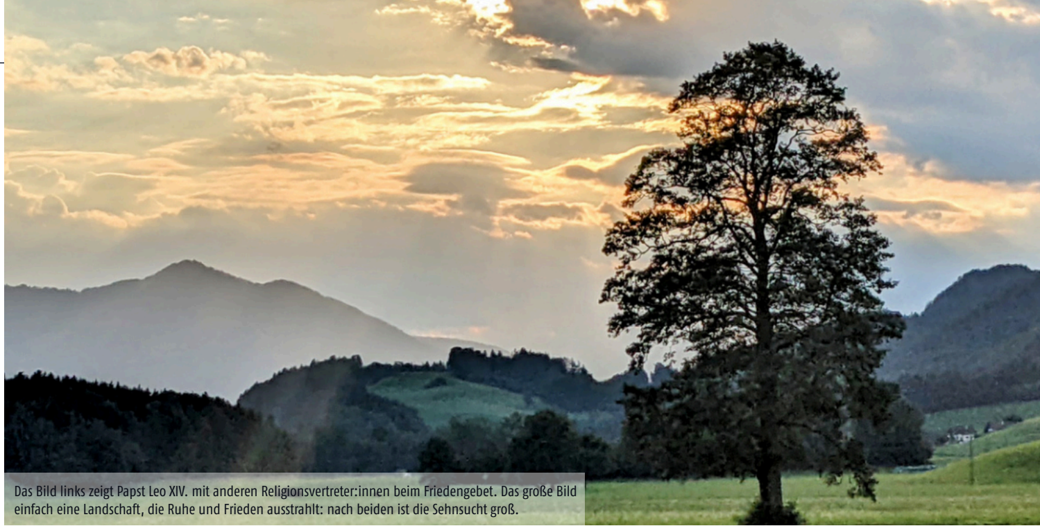
Das Bild links zeigt Papst Leo XIV. mit anderen Religionsvertreter:innen beim Friedengebet. Das große Bild einfach eine Landschaft, die Ruhe und Frieden ausstrahlt: nach beiden ist die Sehnsucht groß.